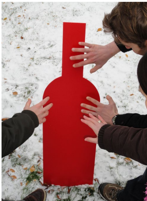
L'acquisition des invisibles, 2010

Par ailleurs, de nombreux discours veulent (re)venir à une « responsabilisation » plus importante des parents. Par là, il faut en-